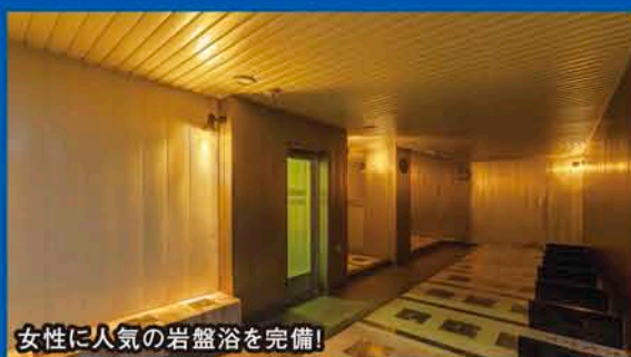
女性に人気の岩盤浴を完備!