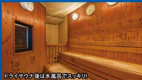
ドライサウナ後は水風呂でスッキリ!