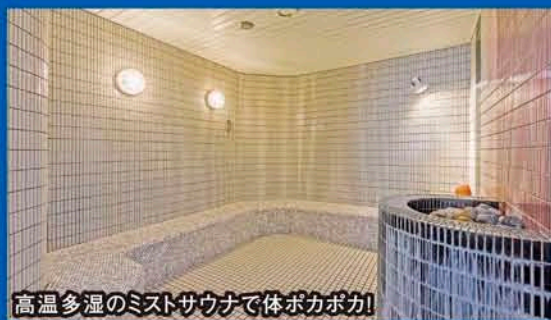
高温多湿のミストサウナで体ポカポカ!