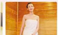
ガス遠赤外線サウナ